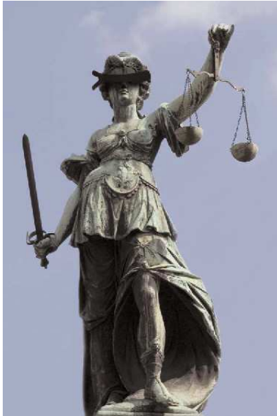
Gerechtigkeitsbrunnen vor dem Frankfurter Römer

Zum Sinnbild der Gerechtigkeit ist in der westlichen Welt die römische Göttin Justitia geworden. Sie verkörpert die Gerechtigkeitsprinzipien der Justiz: